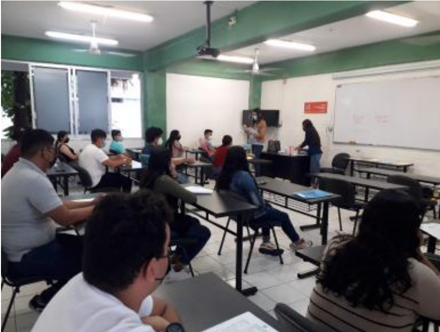
Proceso de admisión 2021 Aplicación del EXANI II