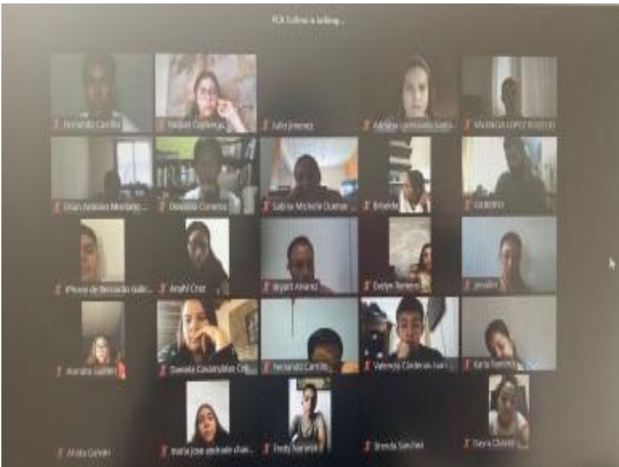
Reunión con estudiantes