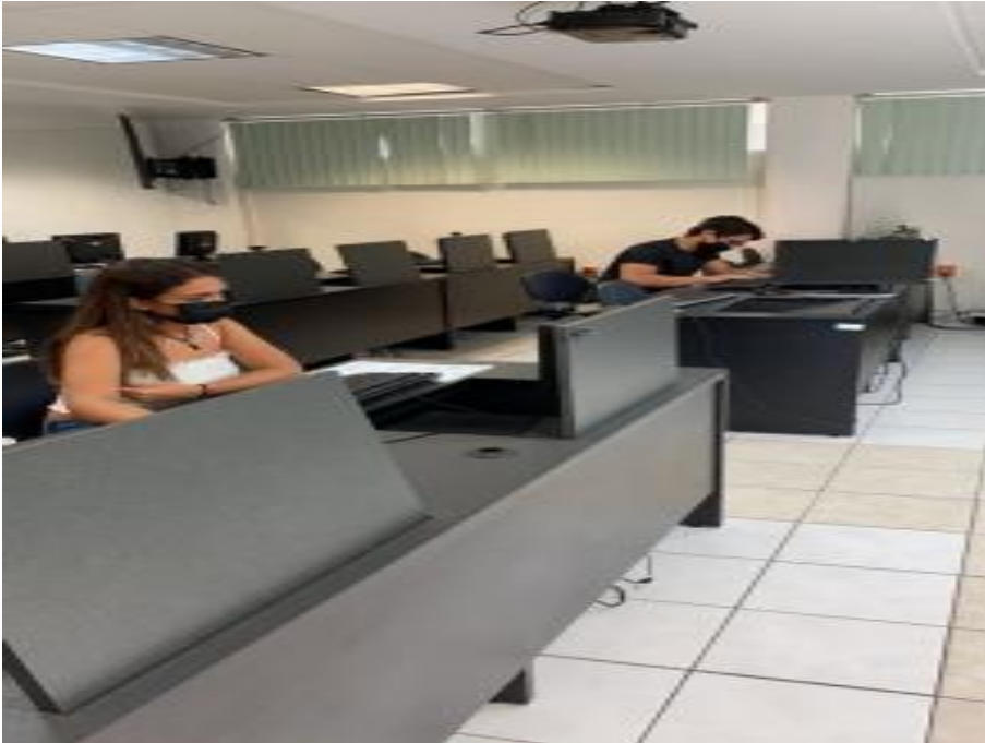
Proceso de admisión 2021