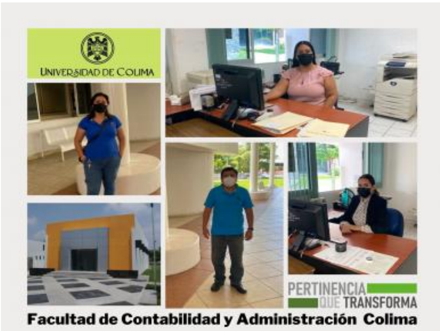
Personal Personal de la FCAC