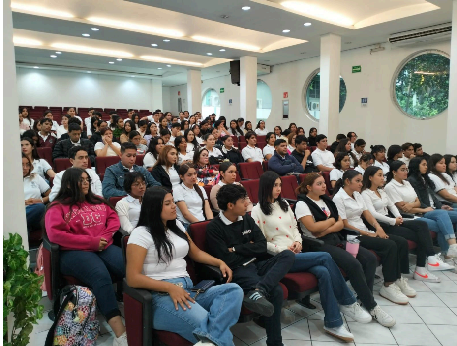
Imagen 1. Matrícula escolar