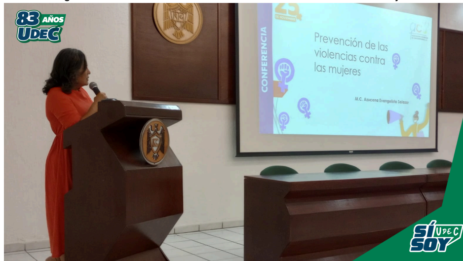
Imagen 15. Conferencia “Prevención de las violencias contra la mujeres”