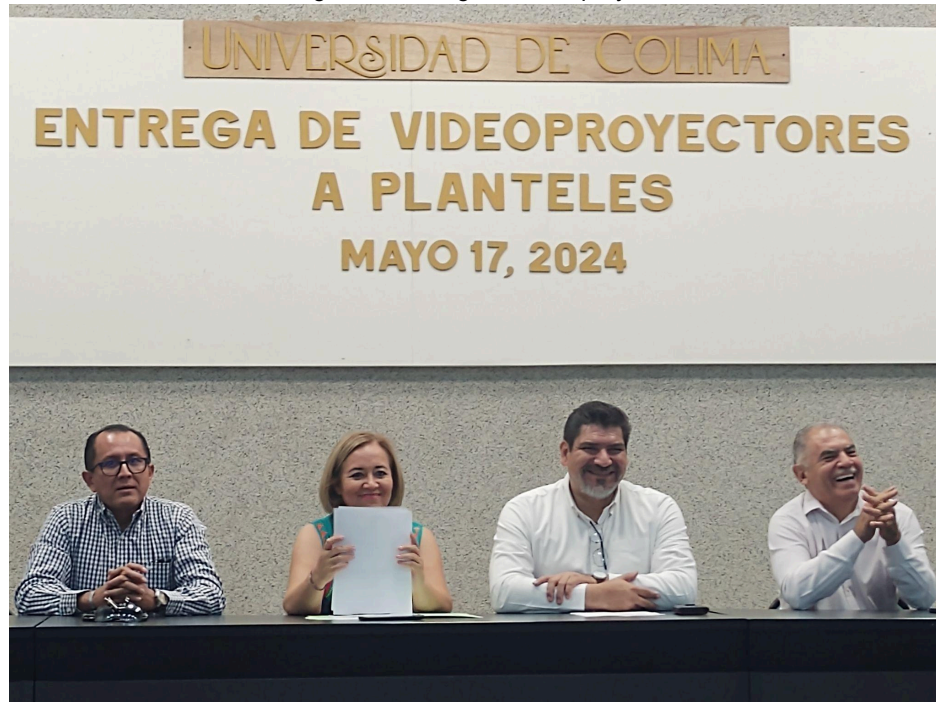
Imagen 19. Entrega de videoprojector