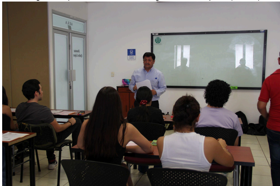
Imagen 16. Aplicación del examen de ingreso al nivel superior (Exani-II)