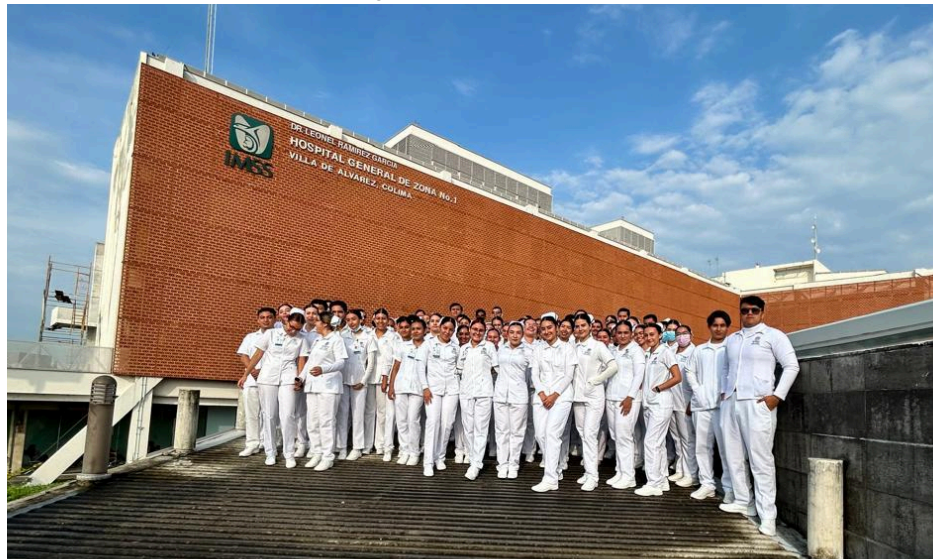
Imagen 14. Campo clínico