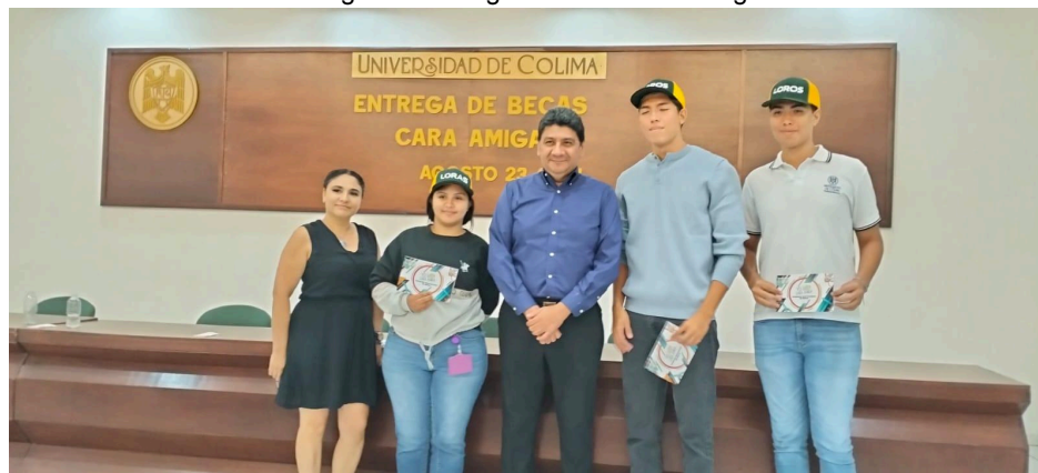
Imagen 2. Entrega de beca Cara amiga