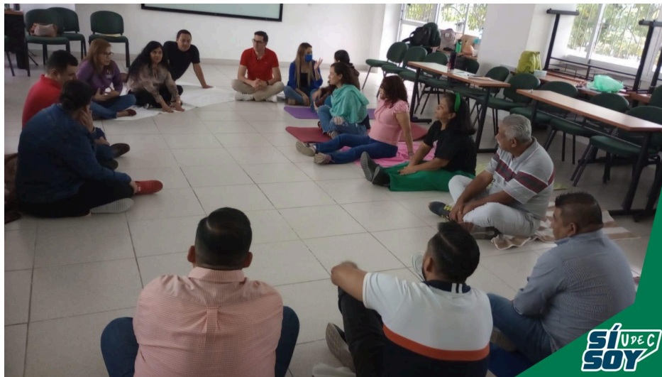
Imagen 10. Curso Taller Expresando tu Energía Vital